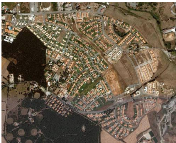
Fig. c: Roma, Tor Pagnotta Est; Fonte: Immagine Google Earth, 2007

L'esigenza di fuggire dalla città dello smog e del caos, delle case vecchie e dei condomini-alveare verso abitazioni che posseggono un giardino e magari un posto auto sicuro, sta spingendo molti ex abitanti della zona centrale o semi periferica verso l'area periurbana, area che ha nell'impianto viario romano e nel G.R.A. il miraggio di un collegamento funzionale con il centro e con il luogo di lavoro (fig. c).