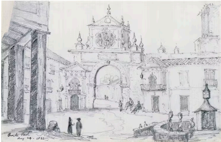
La Puerta Real desde el interior de la ciudad, Richard Ford, 1832.

Las transformaciones de aquel entorno también se reflejaron en diversos planos históricos. El primero de ellos fue el plano de Olavide de 1771 . De gran valor resultan los planos de alineaciones de fachadas de finales del siglo XIX conservados en el Ayuntamiento de Sevilla. En ellos se detalla la posición de la Puerta Real, que concuerda con la documentación gráfica sobre la excavación arqueológica que descubrió su cimentación en 1995.