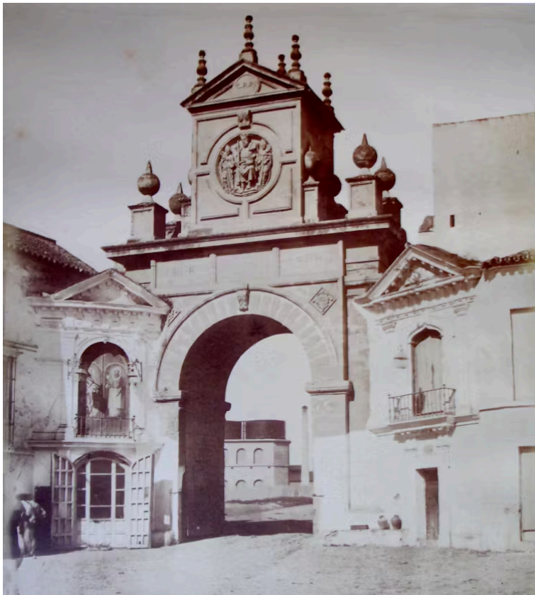
Fotografía de la Puerta Real tomada por Luis Masson hacia 1858. Colección Duque de Segorbe

Para recrear esta composición clásica se han consultado tratados de arquitectura de la época, como el manuscrito de Hernán Ruiz II , el tratado de Serlio y el de Vignola .