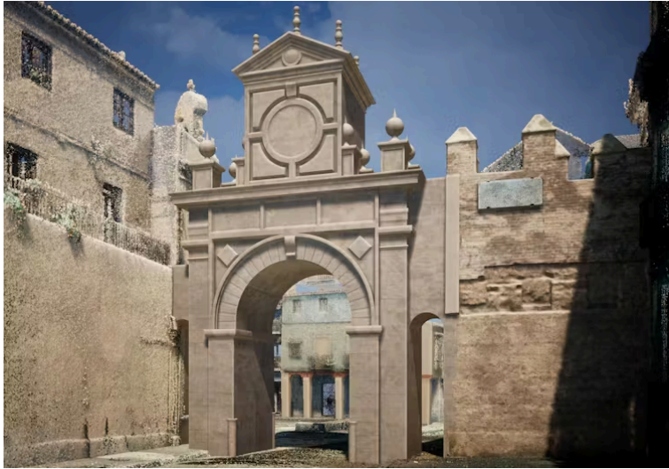
Recreación gráfica de la Puerta Real en Sevilla. Gámiz, Antón, Barrero, 2023

La Puerta Real era sin duda una de las más bellas del recinto amurallado de Sevilla. Por todo ello, esta joya del siglo XVI debería reconstruirse como símbolo de identidad y fuente de progreso para la ciudad.